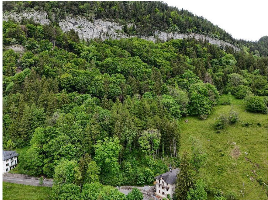
vue aérienne de l'Auberge avec la zone de chutes de pierres et de blocs (paroi de la Gollèze)

Au vu de l'historique du bâtiment et de sa valeur touristique pour le hameau de Morcles, la mise en place d'une mesure physique de protection du bâtiment sous la forme d'un filet pare-pierres est souhaitée, tant par le propriétaire de l'Auberge que par la commune de Lavey-Morcles. Cette mesure permettrait d'assurer la sécurité des habitants et visiteurs de la commune, ce qui représente une priorité essentielle pour la municipalité. De plus, cette mesure de protection permet d'assurer la sécurité de la route et de ses usagers.