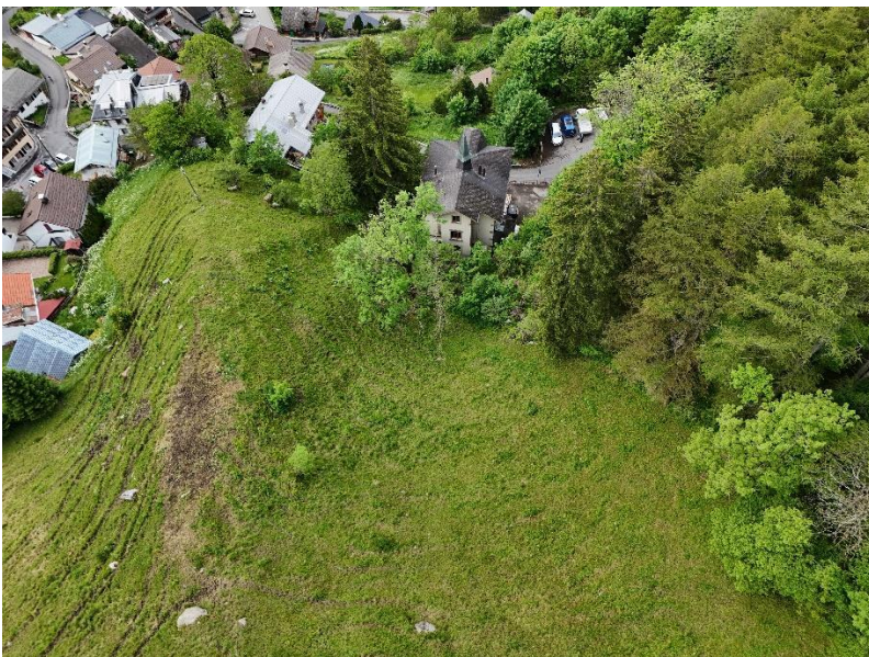
Vue aérienne sur l'arrière (façade nord-est) de l'Auberge

En l'état actuel des lieux, l'intégrité des personnes est menacée à l'extérieur de l'auberge sur le côté de sa façade nord-ouest et également à l'intérieur du bâtiment car des chutes de blocs avec des énergies fortes peuvent détruire ses murs. La vulnérabilité de la construction peut être considérée comme forte car les énergies observées peuvent provoquer des dégâts à la structure porteuse. Le calcul du risque montre des résultats inacceptables et des mesures doivent être mises en place.