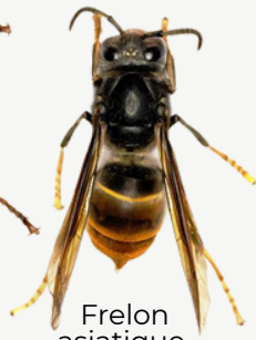
Frelon asiatique 3 cm